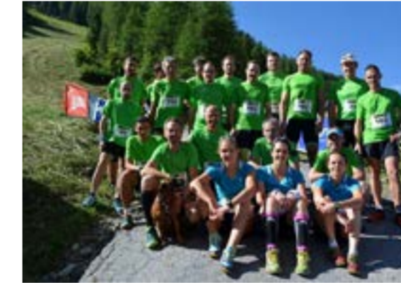
Team „Treibjagd“ stärkste Mannschaft 2015 und 2016

06. August 2017 Heuer bereits zum 19. Mal wird der anspruchsvolle Berglauf „Stettiner Cup“ inmitten des Naturparks Texelgruppe am Fuße der 3480 Meter hohen Hochwilde ausgetragen. Der Berglauf bietet den Läufern Jahr für Jahr ein einzigartiges Lauferleb- nis vor imposanter Bergkulisse. Die Sportler bewältigen auf einer Strecke von 9,8 Kilometern und 1255 Höhenmetern hinauf auf die Stettiner Hütte.